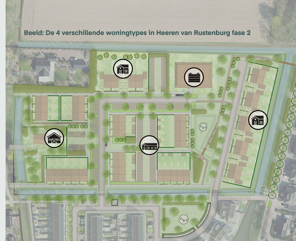
Beeld: De 4 verschillende woningtypes in Heeren van Rustenburg fase 2